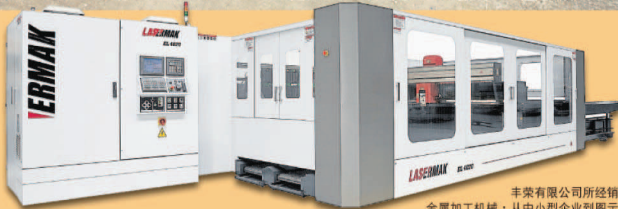
丰荣有限公司所经销的金属加工机械，从中小型企业到图示的高科技Ermaksan激光切割机均有，满足所有金属加工厂家的需求。

“丰荣在有效进行组织管理以及质量控制底下，得以保证客户所购买的机械，蒙受的风险极低，再加上我们30年经验的强大技术团队为后盾，顾客取得的不仅是机械，而还包含安心。”